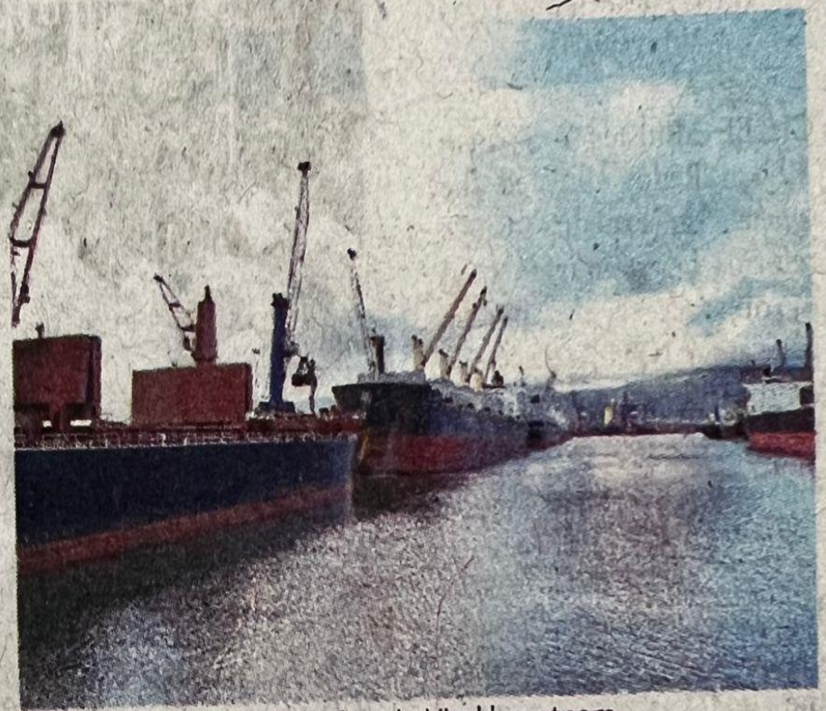
A view of Visakhapatnam Port in Visakhapatnam

Compared to the previous corresponding year, the steam coal cargo witnessed a 67 per cent growth in 2022-23, while POL and crude oil registered a 13 per cent growth. As a part of its modernisation activities, the VPA handled bigger vessels, including the Baby Cape vessel last December. With post as the landlord model, three projects taken up under public-private-partnership